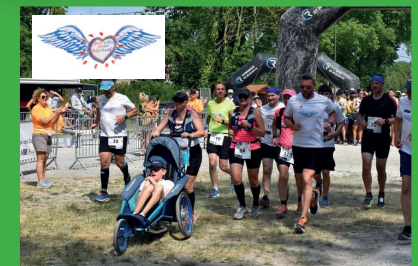
Maison de la nature Parc Galamé

Organisé par les Foulées Loonoises, avec le concours de la ville de Loon-Plage, de l'USD Athlétisme, de la Croix Blanche, de ses Partenaires.