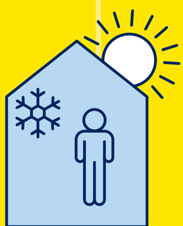
RESTEZ AU FRAIS