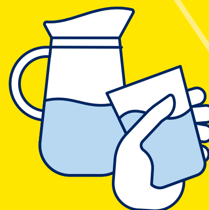
BUVEZ DE L'EAU